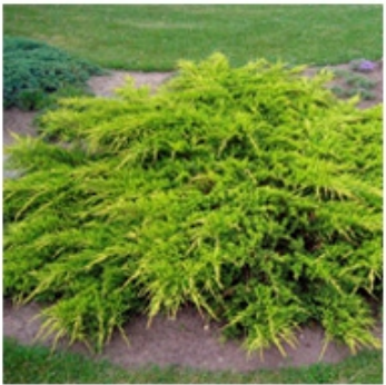
Можжевельник средний "Pfitzeriana Aurea "

Размер: Высота 3 ширина 4-5м. В 10 лет 1,2м. в высоту и 2 в ширину. Темп роста: медленный. Хвоя: чешуйчатая светло-зеленая. Крона: раскидистая, плотная. Свет: Светолюбивая, полутень, тнев-ая. Почва: не требователен. Морозостойкость: (3) зимостойкая.