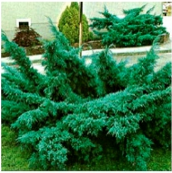
Можжевельник средний "Pfitzeriana Glauca"

Размер: В 10 лет 1м. высоты, 2-3м. шир. В 30 лет высота 1,5м. ширина 3м. Темп роста: относительно медленный. Хвоя: игольчатая, серебристо-серая-зелёная. Крона: неравномерная, раскидистая. Свет: Светолюбивая, полутень, тенева-ая. Почва: не требовательная. Морозостойкость: зимостойкая.