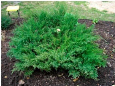
Можжевельник средний "Pfitzeriana Compacta"

Размер: Вырастает до 3 в высоту и 5 в шир. В 10 лет высота 1м. ширина 2-3м. Темп роста: 15-20см. в год. Хвоя: желто-зеленая, мягкая, чешуйч-ая. Крона: раскидистая. Свет: Светолюбивая, полутень. Почва: не требователен. Морозостойкость: (3b)зимостойкая.