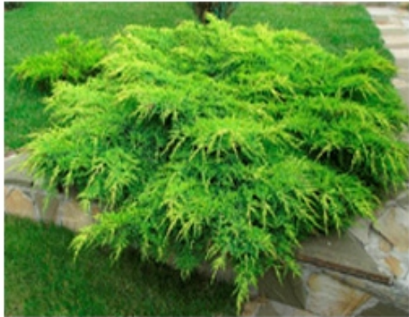
Можжевельник средний "Pfitzeriana"

Размер: В 10 лет 1м. высоты, 2-3м. шир. В 30 лет высота 1,5м. ширина 3м. Темп роста: относительно медленный. Хвоя: игольчатая, серебристо-серая-зелёная. Крона: неравномерная, раскидистая. Свет: Светолюбивая, полутень, тенева-ая. Почва: не требовательная. Морозостойкость: зимостойкая.